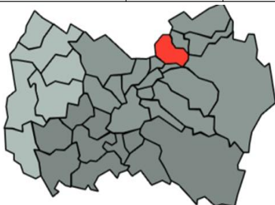
Marcado en "Rojo" está Rancagua, Capital regional.

❖ Cada comuna de la región recibirá talleres para beneficiar a sus vecinos. La distribución por provincia será la siguiente.